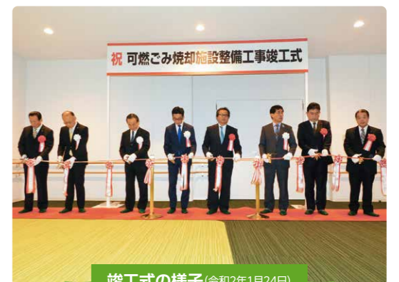
竣工式の様子(令和2年1月24日)

工事期間中は、多大なご不便ご迷惑をお掛けいたしました。住民の皆さまのご理解ご協力をいただきまして、無事工事を完成することができました。今後20年間、民間事業者が施設の運営を行ってまいります。引き続き安心・安全・安定したごみ処理を行ってまいりますので、どうぞよろしくお願いいたします。