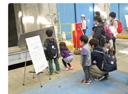
ダンピングボックス