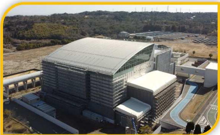
RDF化施設棟 (令和7年3月)